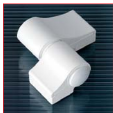
Двухсекционная петля LOIRA+