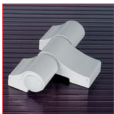
Трехсекционная петля LOIRA+

Начнем знакомство с петлей с внешних отличий. Корпус и наружные крышки выполнены из экструдированного профиля. Петля лишилась мягких, закругленных форм, но приобрела четко выраженные контуры. Крышка значительно увеличилась в размерах и теперь практически полностью обхватывает корпус. За счет этого исчезла линия разреза «корпус/крышка» с видовой поверхности. В предыдущих семействах петель верхняя и нижняя крышки выполняли роль фиксаторов регулировок, в новом семействе – это декоративные крышки с простой фиксацией. Вот, пожалуй, и все видимые отличия. Основные новшества находятся внутри петли, о чем мы сейчас и будем подробно рассказывать.